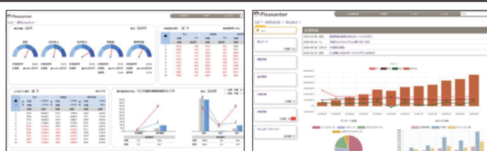
基幹連携でダッシュボード化 マイページ風にカスタマイズ

インターフェイスのカスタマイズや、周辺システムとのデータ連携など、パワフルな拡張機能で複雑な業務要件にも対応可能。標準機能だけでは満たせない業務要件は、スクリプトを使って機能を拡張。フルスクラッチのおおよそ 1/3 の工数でシステムを開発できます。